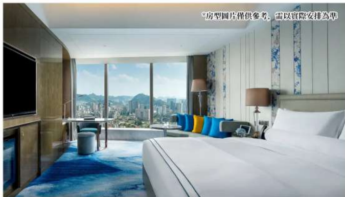
*房型圖片僅供參考，需以實際安排為準