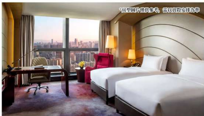
*房型圖片僅供參考，需以實際安排為準