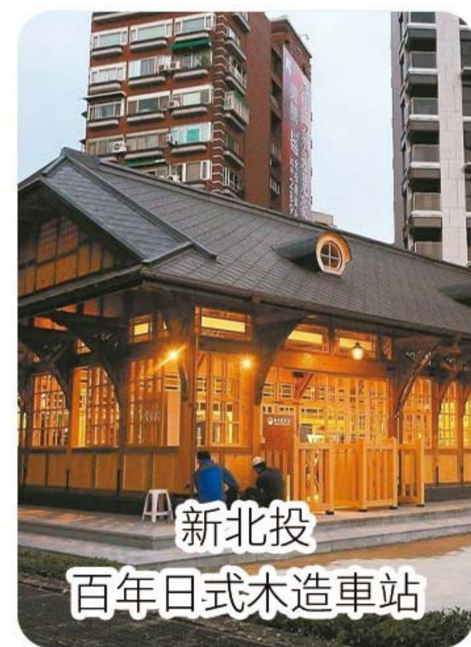
新北投 百年日式木造車站