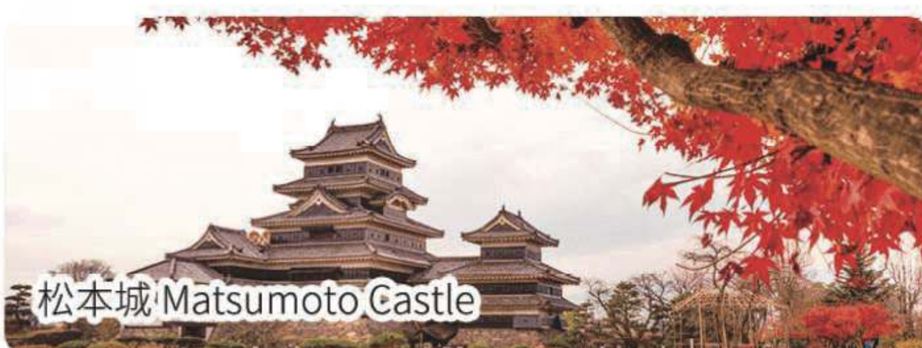
松本城 Matsumoto Castle

🏠 住：松本花月酒店或同級 Matsumoto Hotel Kagetsu or similar