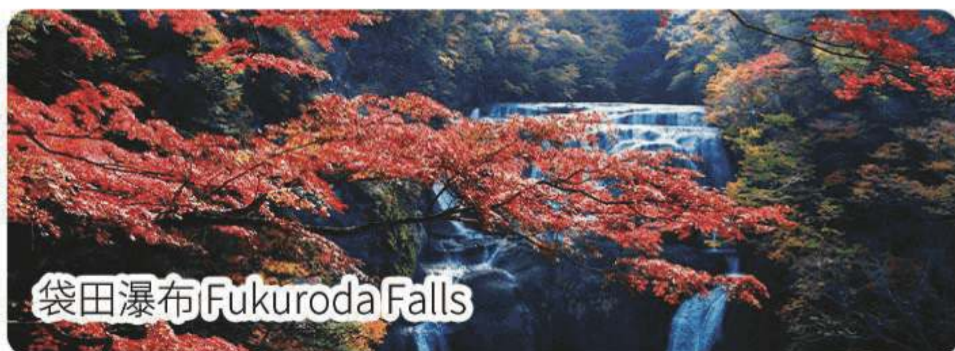
袋田瀑布 Fukuroda Falls

🏠 住：鬼怒川溫泉酒店或同級 Kinugawa Onsen Hotel or similar