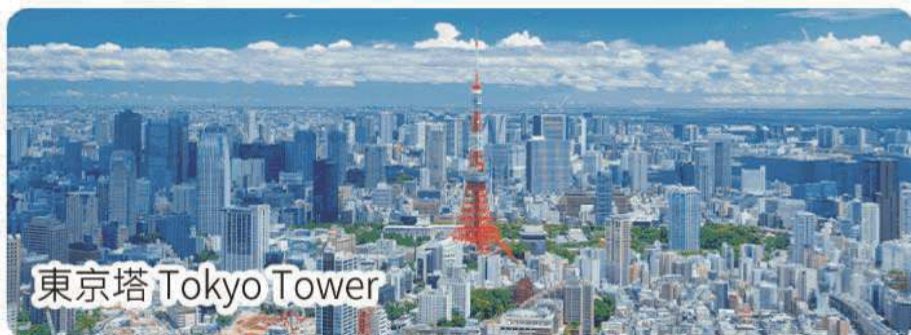
東京塔 Tokyo Tower

🏠 住：東京圓頂酒店/新宿格蘭貝爾或同級 Tokyo Dome Hotel/Shinjuku Granbell or similar