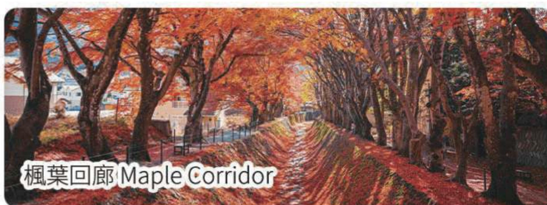
楓葉回廊 Maple Corridor

🏠 住：富士河口湖度假酒店或同級 Fuji Kawaguchiko Resort Hotel or similar