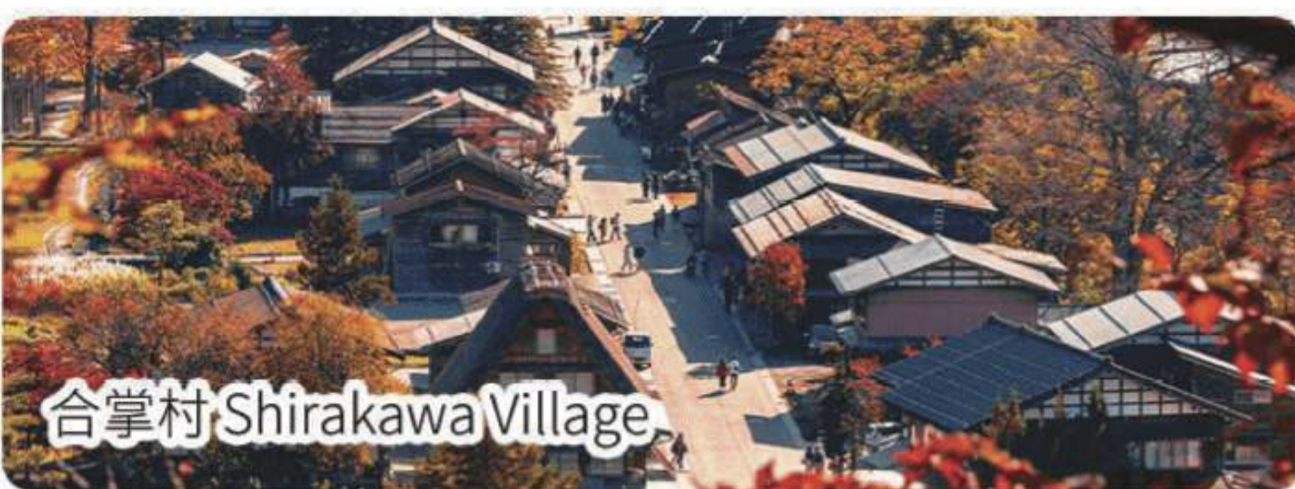
合掌村 Shirakawa Village

🏠 住：雅高高山度假酒店或同級 Takayama Associa Hotel or similar