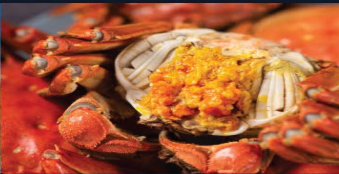
陽澄湖正宗大閘蟹宴 城隍廟老區 大報恩寺和天工造物藝術館