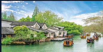
天下第一水鄉烏鎮 烏鎮西欄 中山陵