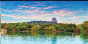
漫步西湖 長廣溪濕地公園 上海外灘