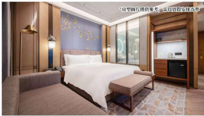
*房型圖片僅供參考，需以實際安排為準