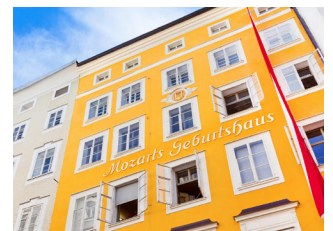
Mozart Geburtshaus - 莫扎特的出生地