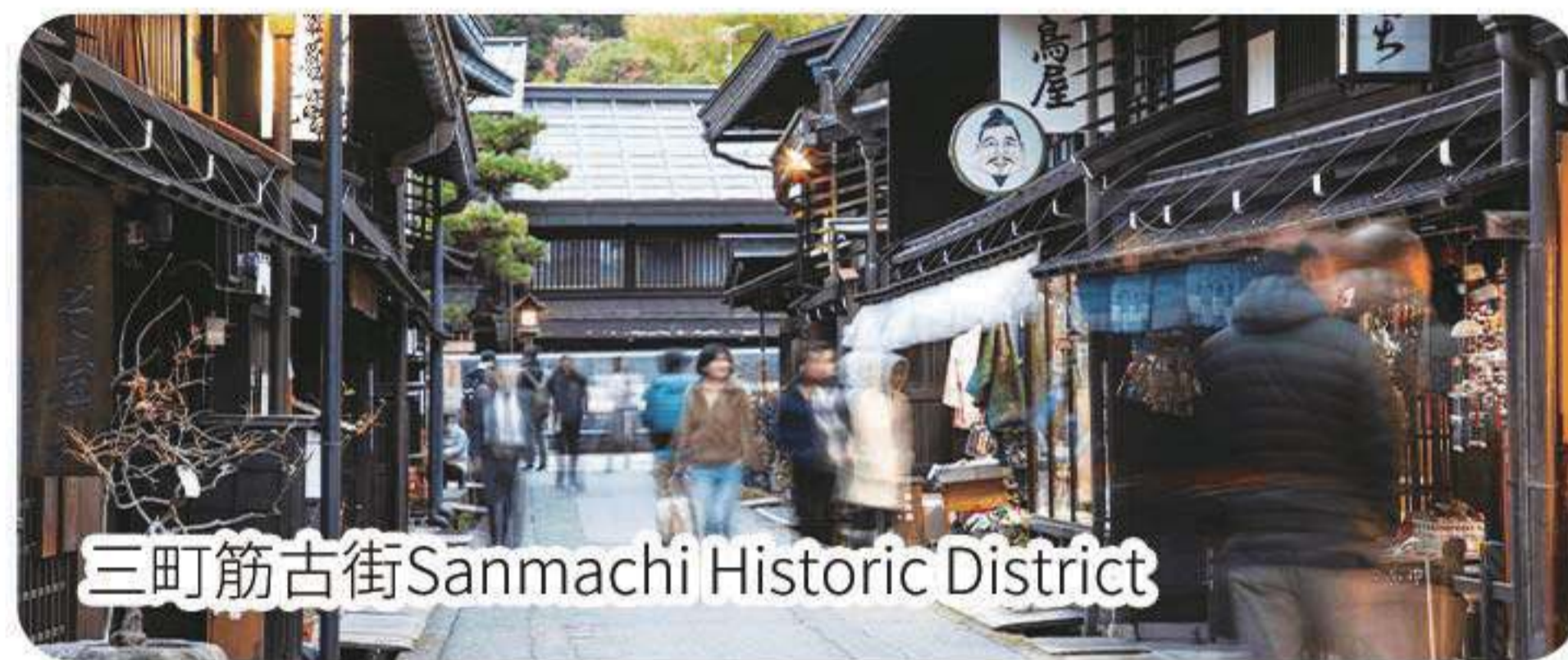
三町筋古街Sanmachi Historic District