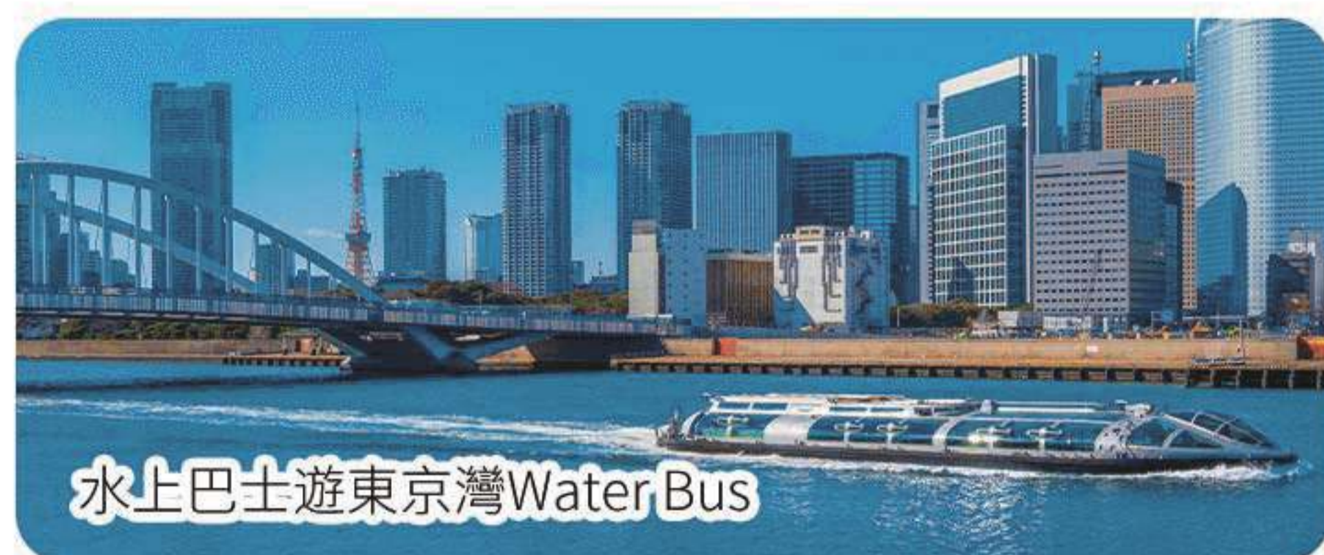
水上巴士遊東京灣Water Bus