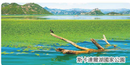
斯卡達爾湖國家公園